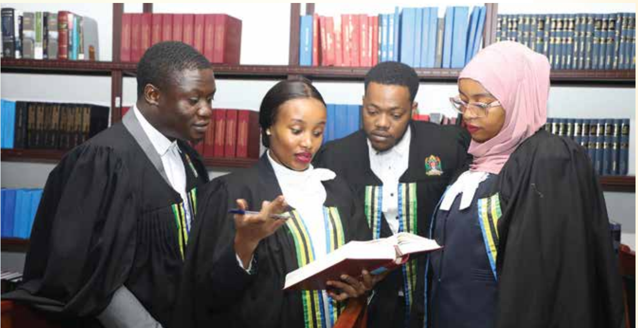
Baadhi ya Mawakili wa Serikali wa Ofisi ya Wakili Mkuu wa Serikali wakifanya utafiti kabla ya Kwenda Mahakamani kuendesha mashauri kwa niaba ya Serikali.