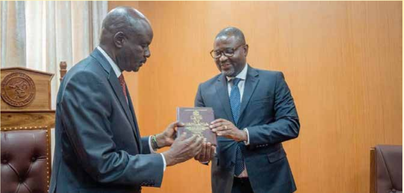
Mwanasheria Mkuu wa Serikali ya Jamhuri ya Muungano wa Tanzania, Mhe. Hamza Johari akimkabidhi Jaji Mkuu wa Mahakama ya Tanzania, Mhe. George Masaju juzuu ya sheria mbali mbali za nchi.

kufanya tathmini madhubuti pindi amri au maamuzi mbalimbali yanapotolewa na Mahakama. Kama shauri tumeshindwa tuwahi kuwasilisha Notisi ya kukata rufaa na kuandika ushauri wa kisheria wa hatua stahiki za kufuata.