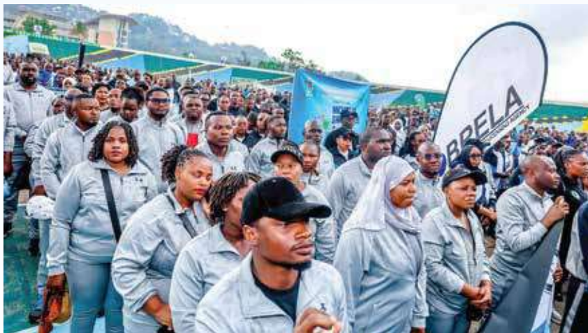
Wachezaji wa timu ya Wakili Mkuu wa Serikali, wakimsikiliza Naibu Waziri Mkuu wa Jamhuri ya Muungano wa Tanzania, Mhe. Dkt. Dotto Biteko wakati akifungua mashindano ya Shirikisho la michezo ya Wizara na Idara za Serikali (SHIMIWI) yaliyofanyika Jijini Mwanza.

Mashindano ya Michezo ya 39 ya SHIMIWI kwa mwaka 2025 yalihitimishwa Septemba 16, 2025, ambayo yaliyoongozwa na kaulimbiu isemayo, "Michezo kwa Watumishi Huongeza Tija Kazini, Jitokeze Kushiriki Uchaguzi Mkuu 2025 kwa Amani na Utulivu".