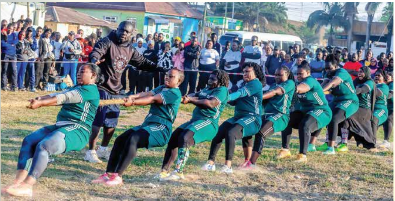
Wachezaji wa timu ya Kamba ya Wanawake wa Ofisi ya Wakili Mkuu wa Serikali wakivuta Kamba dhidi ya timu ya Wanawake wa Wizara ya Viwanda katika mchezo uliofanyika kwenye viwanja vya Furahisha Jijini Mwanza.

Timu ya mpira wa miguu ya Ofisi ya Wakili Mkuu wa Serikali imepangwa kundi E lenye timu za Mahakama ya Tanzania, Wizara ya Kilimo, OSHA na Wizara ya Madini, imeingia mawindoni kujinoa na mchezo unaofuata dhidi ya timu ya Mahakama ya Tanzania, katika mchezo unaotarajiwa kucheza kwenye uwanja wa Shule ya Sekondari ya Wavulana Bwiru iliyopo Jijini Mwanza.