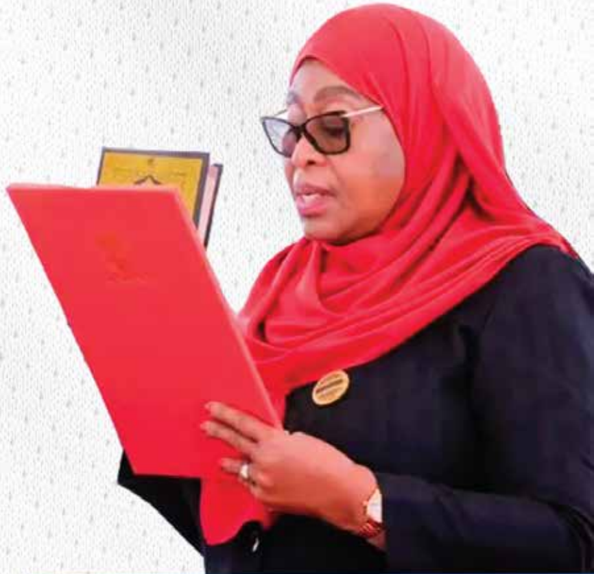
Mhe. Dkt. Samia Suluhu Hassan Rais wa Jamhuri ya Muungano wa Tanzania