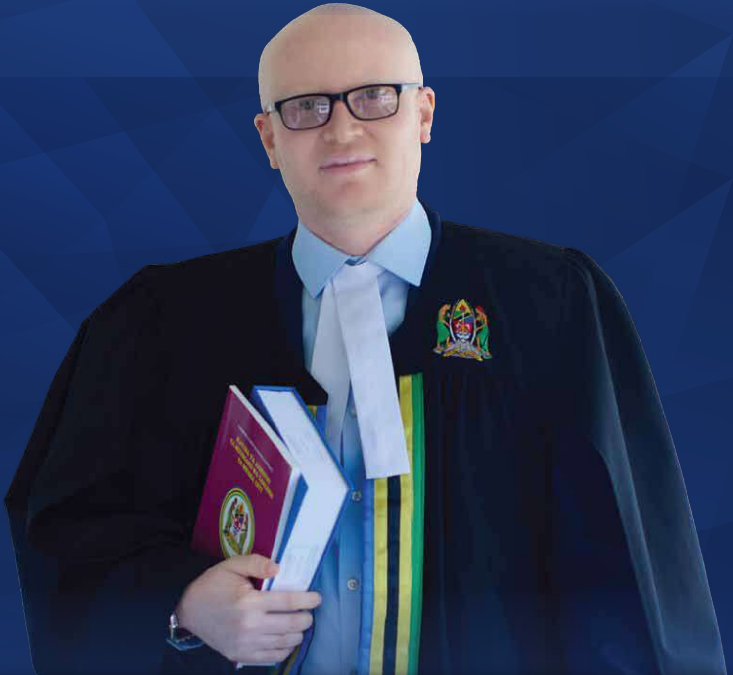
DKT. ALLY POSSI WAKILI MKUU WA SERIKALI

ISSN 2686 | Toleo la Kumi na Tano | Agosti - Novemba, 2025