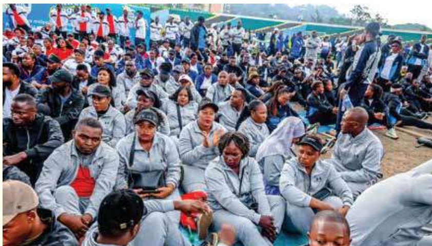
Wachezaji wa timu ya Wakili Mkuu wa Serikali, wakimsikiliza Naibu Waziri Mkuu wa Jamhuri ya Muungano wa Tanzania, Mhe. Dkt. Dotto Biteko wakati akifungua mashindano ya Shirikisho la michezo ya Wizara na Idara za Serikali (SHIMIWI) yaliyofanyika Jijini Mwanza.